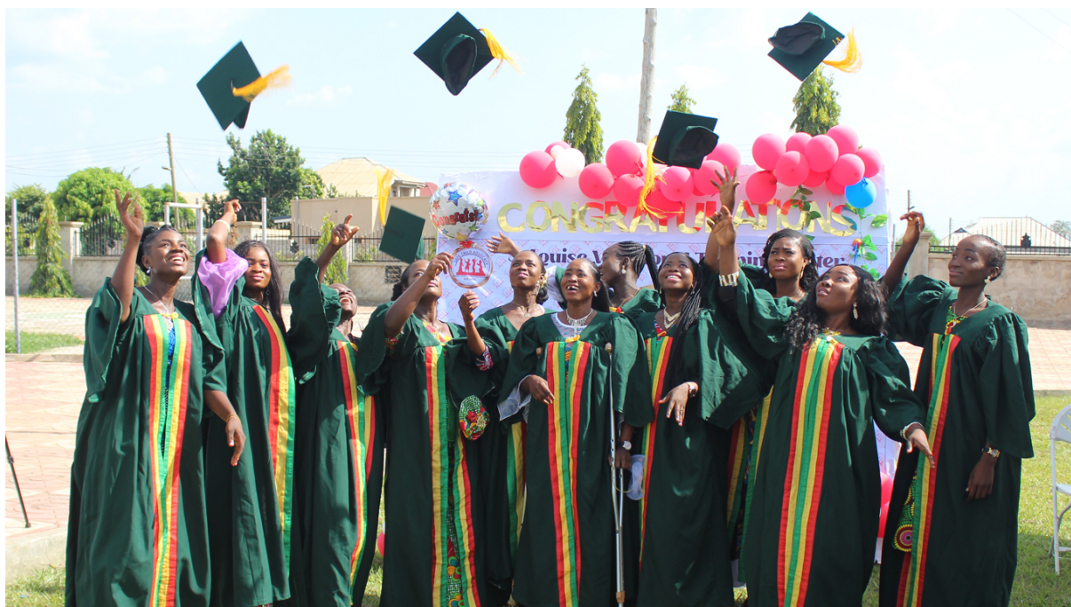
Certificaat afronding beroepsopleiding

Het programma Child Rights – Fase II heeft een looptijd van drie jaar en een jaarlijkse begroting van ongeveer €47.667. Stichting Wilde Ganzen financiert een derde van de kosten, onder de voorwaarde dat de overige middelen via fondsenwerving worden gerealiseerd. Het bestuur van Adamfo Ghana heeft voor dit project aanvullende fondsen gevonden waardoor het project tijdig kan starten.