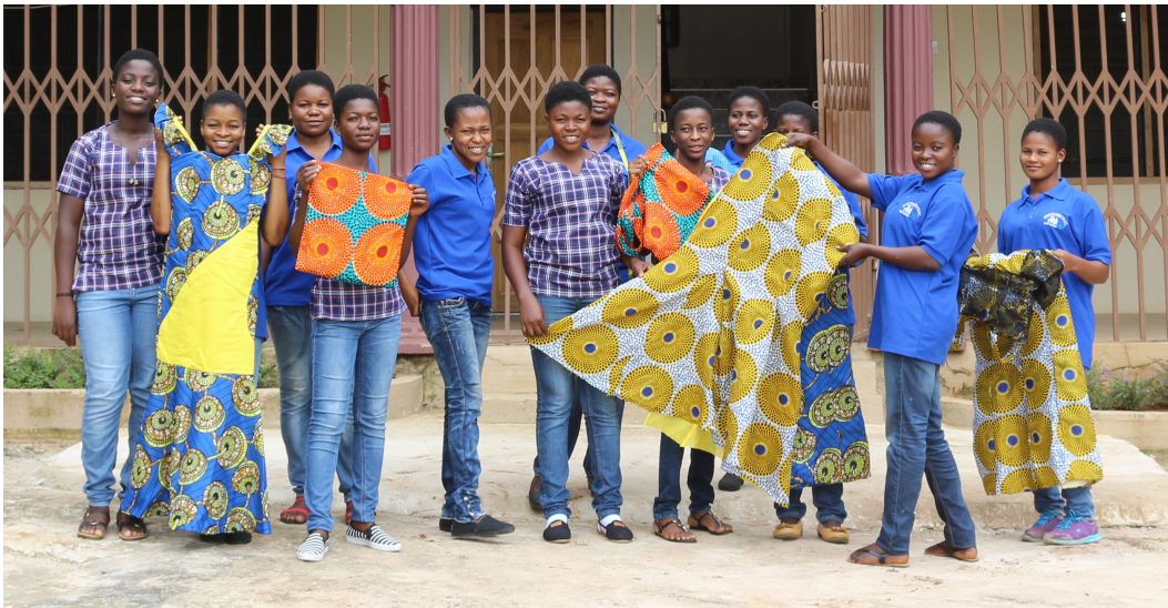
Onze partner in Kumasi, Safe-Child Advocacy, vierde in 2025 haar 20-jarig bestaan!

Samen sterk voor kinderen en jongeren meer kansen door onderwijs en vakopleiding