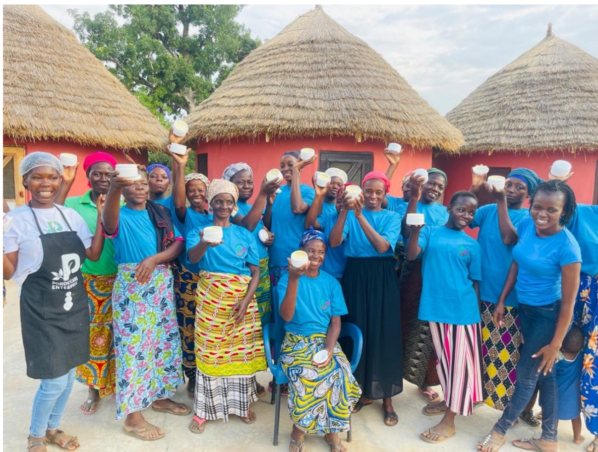
Productie van sheabutter

Dit door CCHO financieel gesteunde project heeft vrouwen economische kansen geboden. Het bestuur van Adamfo Ghana is in overleg met Song-Ba over een aansluitende ondersteuning van de vrouwen coöperatie voor de productie van sheabutter.